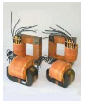
船舶用リアクトル・CT