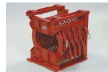
車両搭載用直流リアクトル