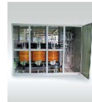
工場受電高圧変圧器盤