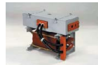
集電ツナギ箱付空心コイル