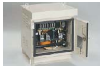
屋外型単相変圧器