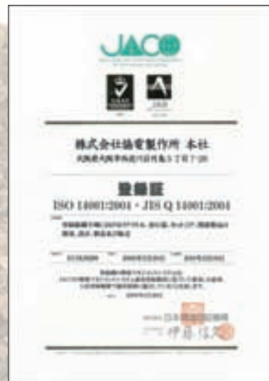
ISO 14001 登録証