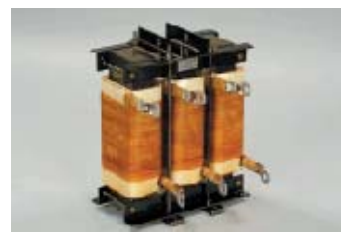
三相交流リアクトル