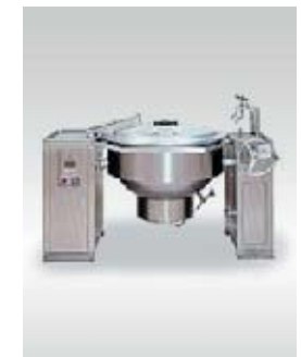
IH誘導加熱式回転釜