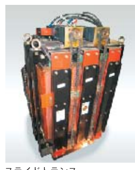
スライドトランス