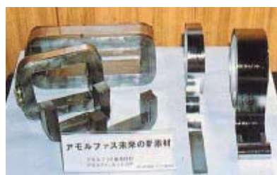
アモルファスカットコア