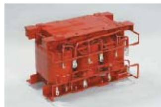
車両搭載用三相変圧器