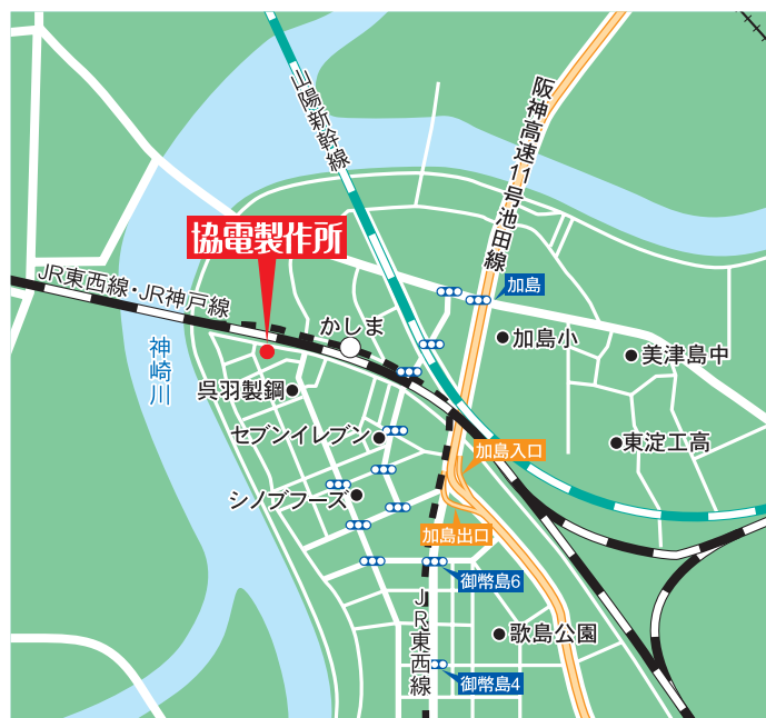
JR東西線加島駅下車 出口③「口」を出て線路沿い徒歩5分