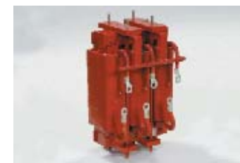
車両搭載用交流リアクトル