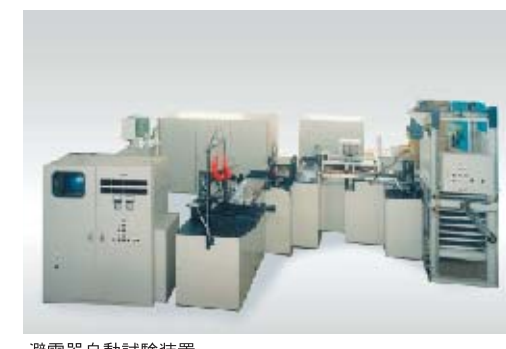
避雷器自動試験装置