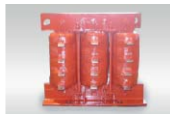
始動用リアクトル