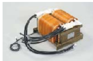
横置き型単相変圧器