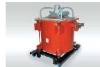
空心直流リアクトル