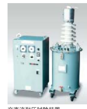
交直流耐圧試験装置