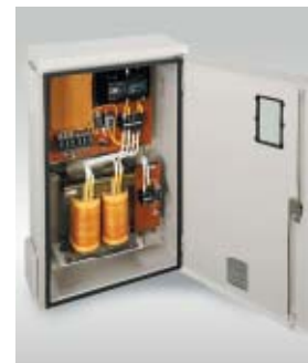
引込盤収納変圧器